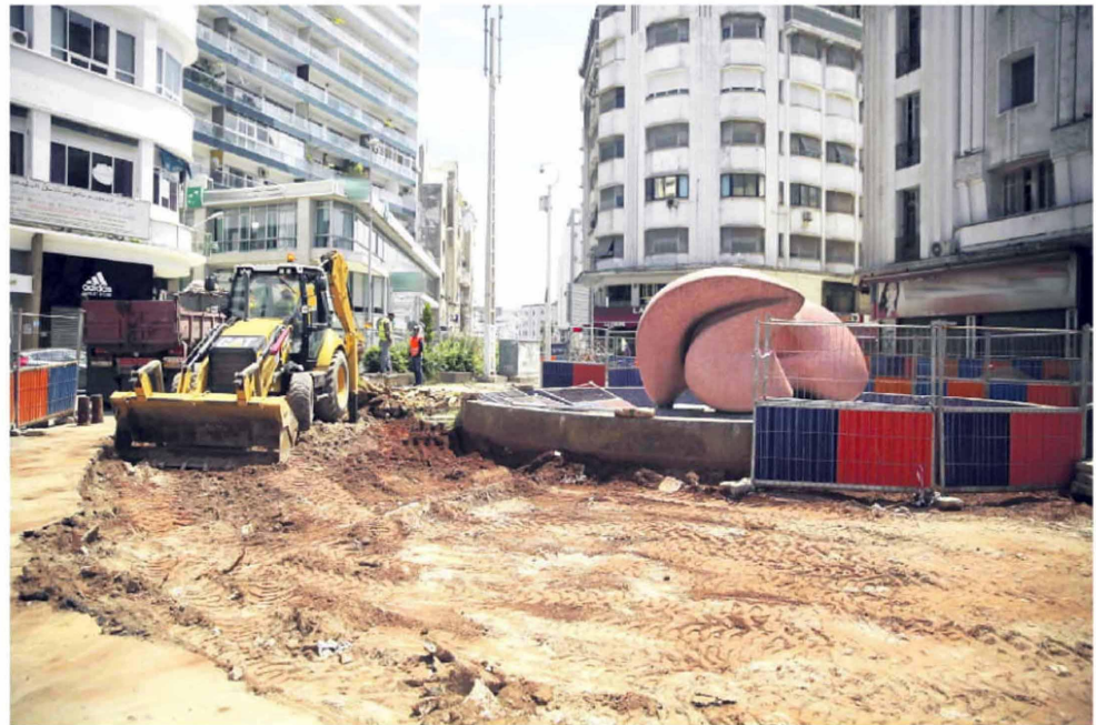
La célèbre fontaine rose qui agrémente la Place du 16 Novembre (en face de l'Institut Goethe) restera en place, contrairement à des rumeurs qui annonçaient sa destruction

Objectif: profiter du confinement pour avancer au maximum d'autant